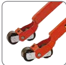
Bogghjul har bremsesikring og er skånsomt mot gulvet.