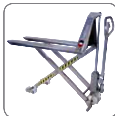
Leveres som manuell, elektrisk, rustfri og eksplosjonssikret.