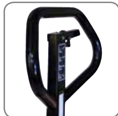
Ergonomisk håndtak gir brukeren et godt grep.