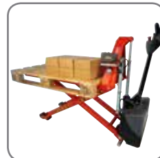
Posisjoneringsutstyr (ekstra utstyr) sikrer konstant arbeidshøyde.