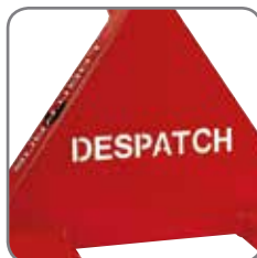
Mulighet for å merke vognen med navn/avdeling.