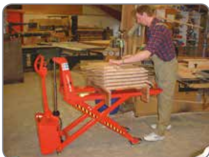
Ekstra utstyr: Fjernbetjening, posisjoneringsutstyr, parkeringsbrems, løs utvendig eller innbygget lader.