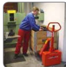
Patentanmeldt sylinderkonstruksjon gir lav byggehøyde.

Vi tilbyr også kundetilpassede løsninger.