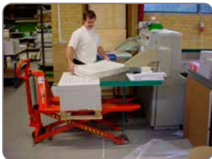
Manuell høytløfter har meget lav pumpekraft, fotbeskyttelse og nøytralstilling på hydraulikken.