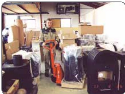
Selv på meget trange plasser sikres det en problemfri håndtering av godset.