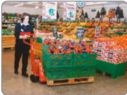
Justerbar gaffelhøyde - ingen problemer med lave og slitte paller.

Jekketrallene fås også i rustfri og eksplosjonssikrede utgaver.