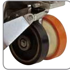
Trallene har minst et utprøvd antistatisk hjul av vulkollan, som avleder statisk elektrisitet.