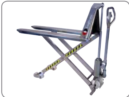
Standard-maskinene er manuelle og produsert i rustfritt stål.