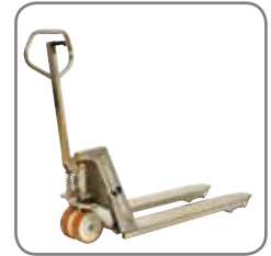
Sterk konstruksjon sikrer lang levetid og lave vedlikeholdskostnader.