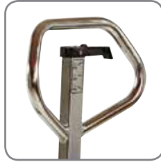
Håndtakets ergonomiske gode gripevinkel gir brukeren et godt grep ved manøvrering.

Maskinene er plassert i gruppe II og er godkjent for områder, som er betegnet som Zone I/zone21 (Dekker også zone 2/zone 22). Det vil si områder, hvor man kan regne med, at det kan forekomme farlig eksplosiv atmosfære på grunn av forskjellige gasstyper eller støv.