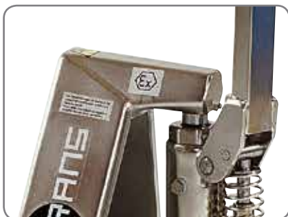
De eksplosjonssikrede trallene er velegnet til farmasøytisk industri, farge-/lakk-industrien samt olje- og gassindustrien.

Spør etter materialspesifikasjoner eller besøk oss på www.logitrans.com Vi tilbyr også kundetilpassede løsninger.